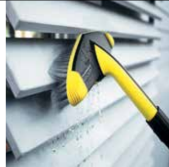
Weiche Waschbürste WB 60