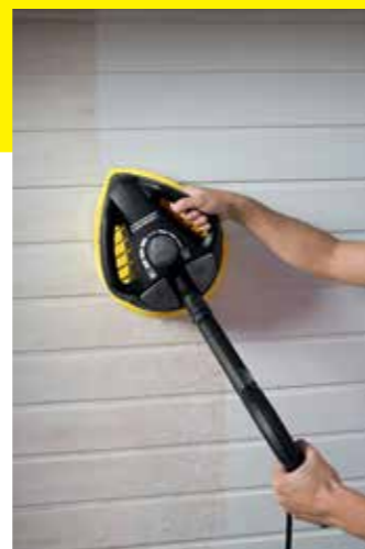
T-Racer T 450