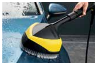
Powerbürste WB 150