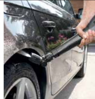
Vario Power Jet Short 360°