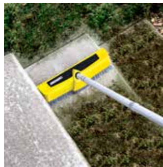
Powerschrubber PS 40