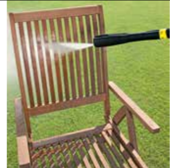
Multi Power Jet