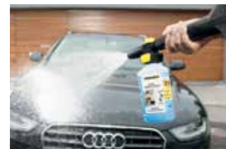
Schaumdüse Connect 'n' Clean

Mit der Powerbürste WB 150 oder der rotierenden Waschbürste WB 100 lassen sich Fahrzeuge besonders effizient und zugleich schonend reinigen. Die Powerbürste hat eine praktische Dreiecksform und arbeitet mit Hochdruck in Kombination mit manuellem Bürstendruck. Die Reinigungswirkung der rotierenden Waschbürste basiert auf einem rotierenden Bürstenkopf und manuellem Bürstendruck.