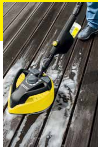
T-Racer T 550

Unsere T-Racer reinigen sowohl harte Flächen wie Stein und Beton als auch empfindlichere Oberflächen (z. B. Holz). Ein ergonomischer Handgriff sorgt dafür, dass sich auch vertikale Flächen wie Garagentore optimal säubern lassen.