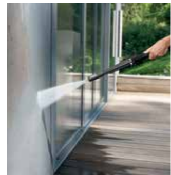
Vario Power Jet

Grober Schmutz wird mit Hilfe des Universalreinigers effektiv gelöst und abgespült. Das Reinigungsmittel wird über das Vario Power Jet im Niederdruck aufgetragen. Nachdem der Universalreiniger und der gelöste Schmutz gründlich abgespült wurden, wird der Glass Finisher im Niederdruck aufgebracht und anschließend mit Hochdruck abgespült. Die Scheiben des Wintergartens trocknen streifenfrei, sofern das Glas nicht beschichtet ist.