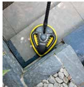
T-Racer T 450

Der Powerschrubber PS 40 verfügt über drei Hochdruckdüsen und eignet sich ideal für die Treppen- und Kantenreinigung.