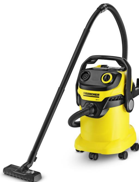
家庭用乾湿両用バキュームクリーナー 「MV 5」

消費電力を18%低減させつつ、従来と同等の吸引力を維持。電気代も節約できエコロジー&エコノミー。