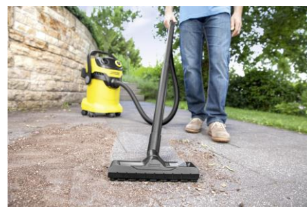
家庭用乾湿両用バキュームクリーナー 「MV 5」使用風景

フロア機能を搭載したほか、消費電力を従来の同等機種と比べ18%低減しており、効率よくエコな清掃が可能です。