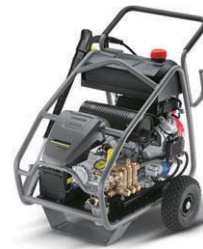
HD 13/35 Ge HD 9/50 Ge