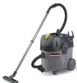
NT 35/1 Tact H*

* 本製品は修理を行うことができません。 本製品使用によるアスベスト被害に対する責任は負いません。 本製品は、製品保証、並びに返品は承っておりません。