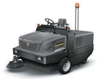
KM 170/600 R D