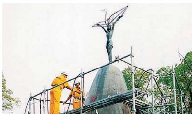
広島平和記念公園/原爆の子の像 (2000)