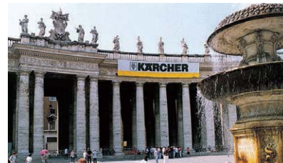
ヴァチカン市国/サン・ピエトロ広場 (1998)