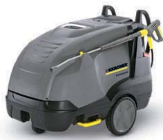
HDS 13/15 S