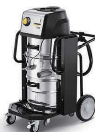
IVC 60/30 Tact 2