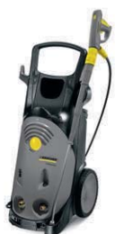
HD 10/22 S