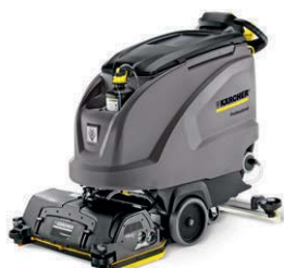
BR 55/60 W Bp DOSE