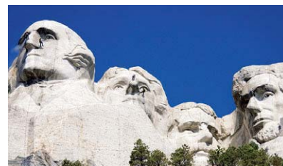
マウンラッシュモア/大統領巨大彫像 (2005)