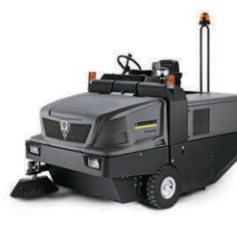
KM 150/500 R D