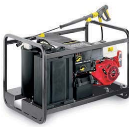
HDS 1000 BE