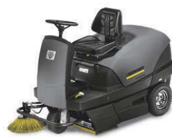
KM 100/100 R