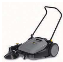
KM 70/20 C