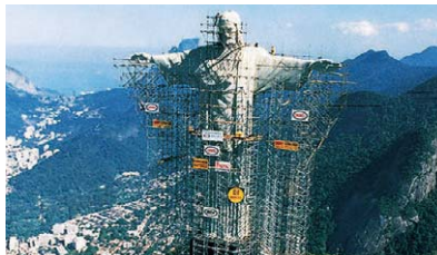
リオデジャネイロ/キリスト像 (1990)