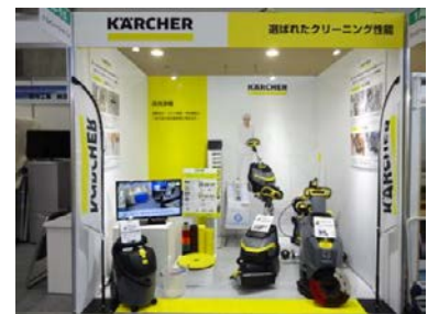
前回出展時の様子

出展スペースを広げた今回のブースでは、食の安全・安心に貢献する各種清掃機器を展示し、作業効率向上と衛生的な環境づくりをご提案します。注力する床洗浄では、水のみで油汚れを落とすイエローパッドをはじめ、お客様のニーズに合った床洗浄機+パッドの組み合わせ等をご紹介します。洗剤コストの削減や作業時間の短縮をしながら衛生的に洗浄し、床面の美観を維持します。