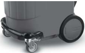
大型タイヤ付で移動もスムーズ

軽量のプラスチックボディなので、作業や移動が楽に行えます。また、丈夫な設計でサビやへこみの心配もありません。