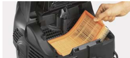
エコフィルターはチリ除去率 99.9%

フィルターは本体上部に位置し、液体を吸引しても濡れにくい構造です。液体や湿ったゴミの吸引でも、フィルター交換が不要です。