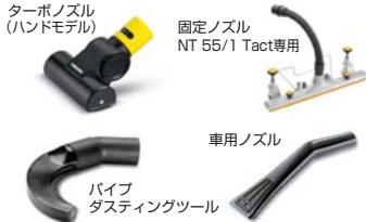
ターボノズル (ハンドモデル)

様々な用途に対応するオプションをご用意しております。状況に合わせてオプションをお選びいただけます。