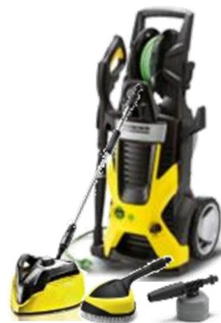
K 7 Premium Eco!ogic Car & Home

Avec une pression allant jusqu'à 160 bar et un débit maximum de 600 l/h, le K7 Premium Eco!ogic est idéal pour une utilisation intensive. Grâce à sa large palette d'accessoires et son détergent adapté à tout type de surface, les travaux de nettoyage les plus divers peuvent être envisagés : vélos, motos, véhicules, mobiliers et outils de jardin, allées, escaliers, SUV, caravane, piscines, murets, terrasses et façades. Kärcher propose également 3 autres modèles pour une utilisation moins régulière. Tous les modèles de la gamme Eco!ogic