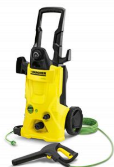
K 4 Eco!ogic

La gamme Eco!ogic se compose de 4 modèles adaptés à chaque type de besoins : K4 Eco!ogic Home, K4 Premium Eco!ogic Home, K5 Premium Eco!ogic Home et K7 Premium Eco!ogic Car & Home.