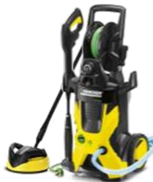
K 5 Premium Eco!ogic Home