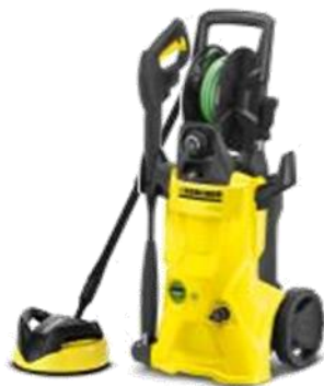
K 4 Premium Eco!ogic Home