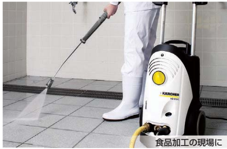
食品加工の現場に