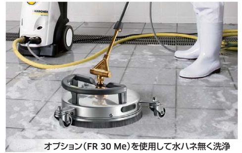
オプション(FR 30 Me)を使用して水ハネ無く洗浄