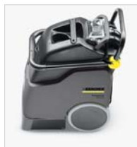
省スペースで収納