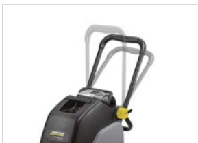
最適な位置に調整して作業効率向上

狭いスペースの清掃に適したコンパクト設計。可動式のハンドルは作業者に合わせて高さの調節ができます。また、折りたたむことで省スペースで収納できます。パンタイプの子に積んで移動することも可能です。