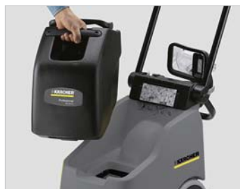
工具を使わず簡単に取り外し可能