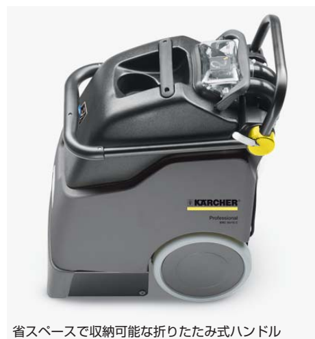
省スペースで収納可能な折りたたみ式ハンドル