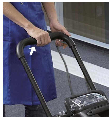
ハンドル部分のスイッチで水の噴出をコントロール