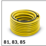
81, 83, 85