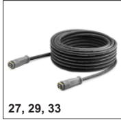
27, 29, 33