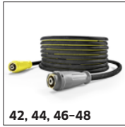
42, 44, 46-48