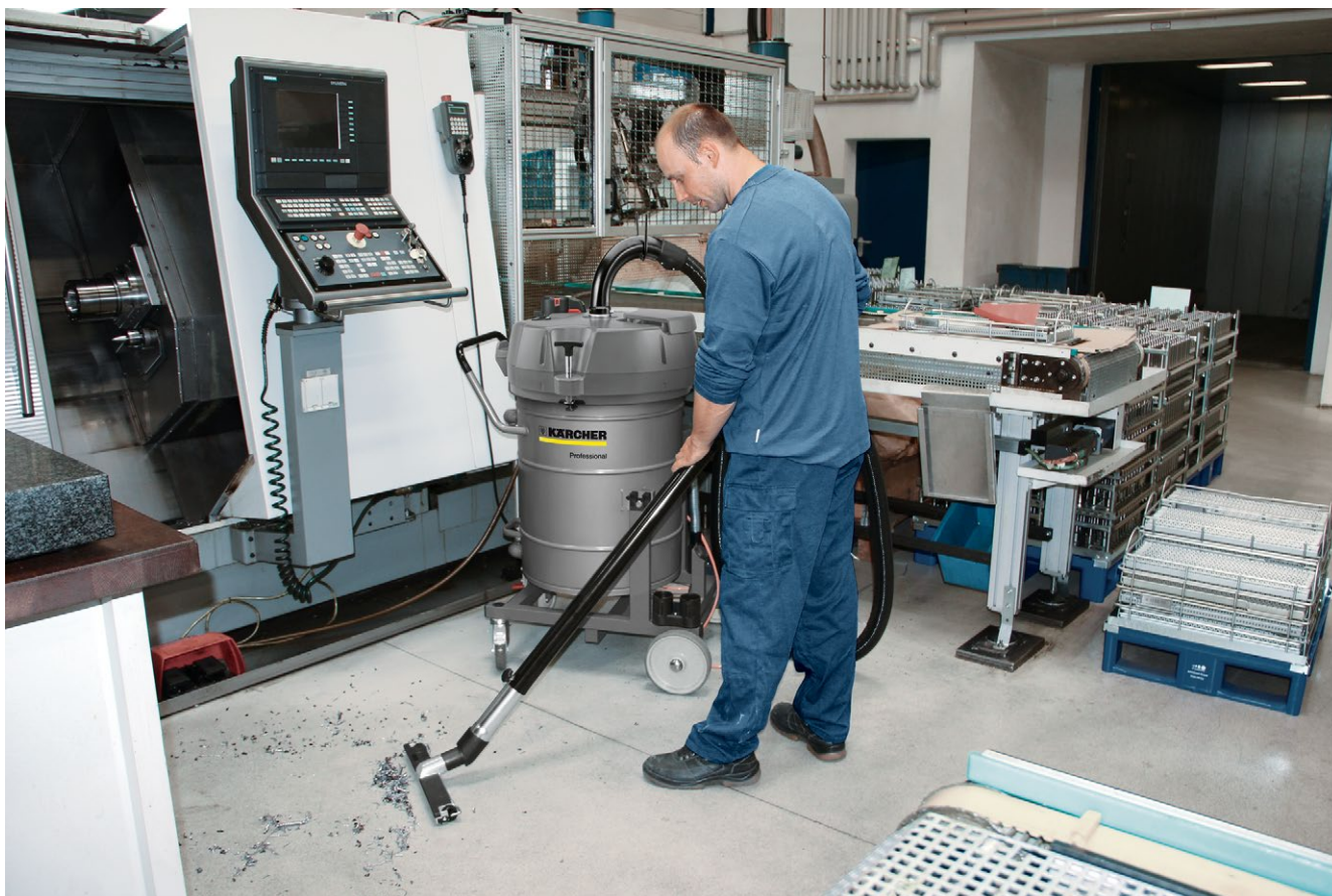
IVR-L 100/24-2 Tc