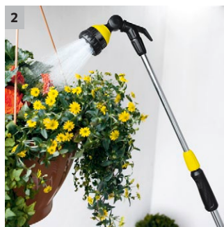
2 Lanza telescópica (70-105 cm)