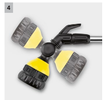
4 Boquilla rociadora giratoria (180°)