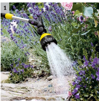
1 6 variantes de chorro