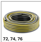
72, 74, 76