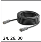
24, 26, 30