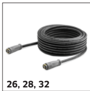
26, 28, 32