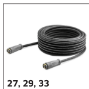
27, 29, 33