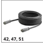
42, 47, 51