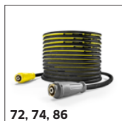
72, 74, 86