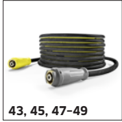
43, 45, 47-49