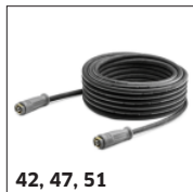
42, 47, 51