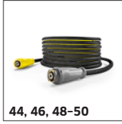
44, 46, 48-50