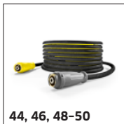
44, 46, 48-50