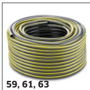
59, 61, 63