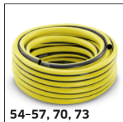
54-57, 70, 73