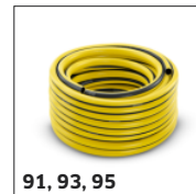
91, 93, 95