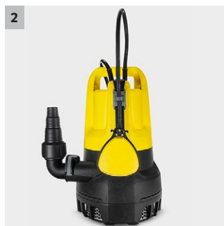
2 L'interruttore galleggiante è regolabile in altezza