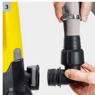
3 Quick Connect: raccordo rapido