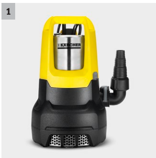
1 Anello di tenuta in ceramica