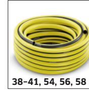
38-41, 54, 56, 58