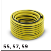
55, 57, 59