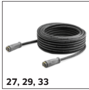
27, 29, 33