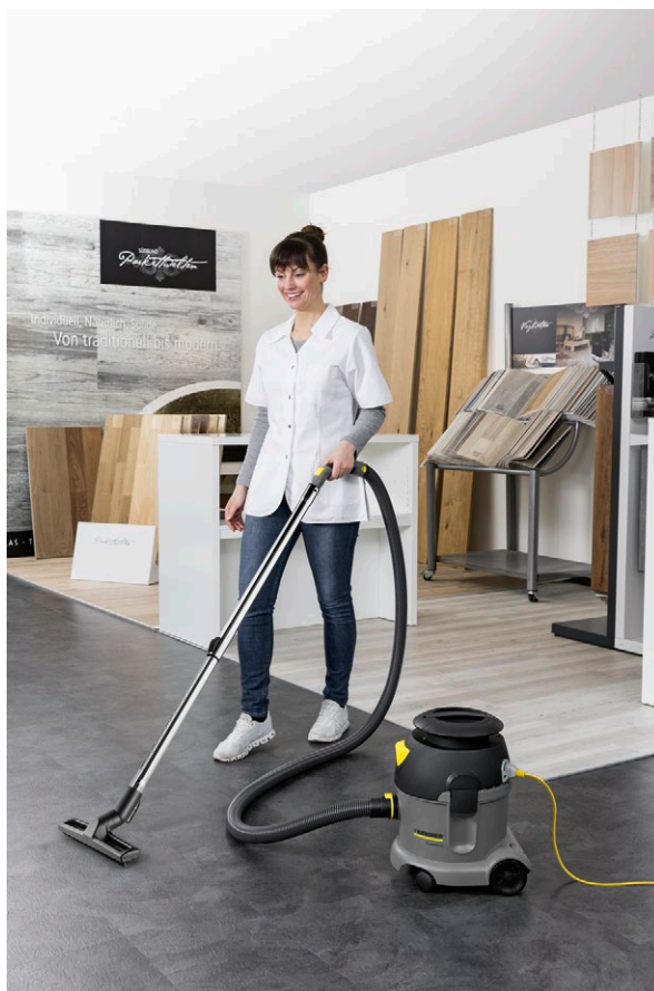
T 10/1 Adv *EU