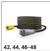
42, 44, 46-48