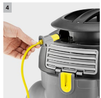
4 Ușor de servizat