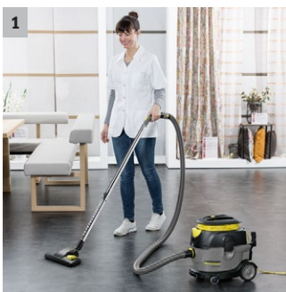
1 Astfel este plăcut să economisești energie!