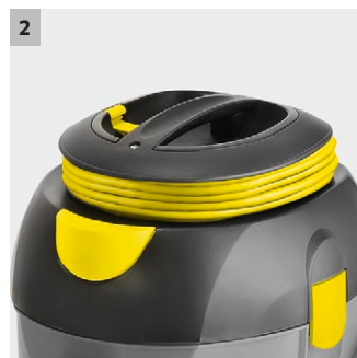
2 Depozitare integrată a cablului