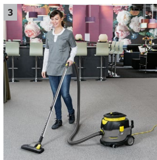
3 Nivel de zgomot scăzut