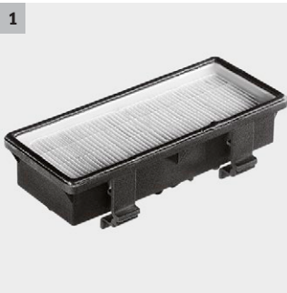
1 Filtrul HEPA pentru gaze de combustie curate

Noul Kärcher T 12/1 este un aspirator extrem de eficient și de silențios. Aparatul este prevăzut cu un comutator comod care poate fi călcat, pentru ușurința în utilizare și dispune de două roți spate și două roți frontale pivotante pentru o manevrabilitate maximă. În ansamblu un aspirator uscat puternic și robust din clasa de mijloc.