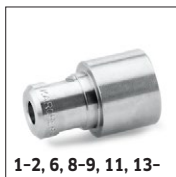
1-2, 6, 8-9, 11, 13-