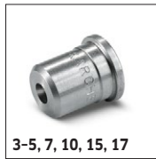
3-5, 7, 10, 15, 17