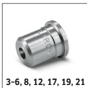
3-6, 8, 12, 17, 19, 21