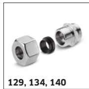
129, 134, 140