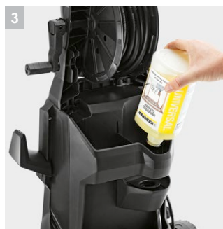
3 Система Plug 'n' Clean