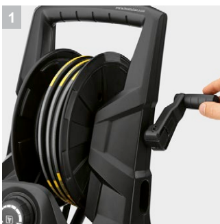
1 Удобство хранения