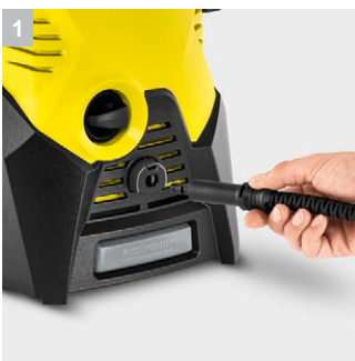
1 Система быстрого подключения Quick Connect