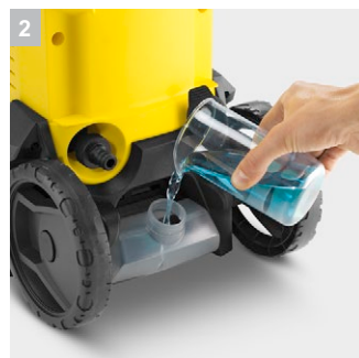
2 Встроенный бак для мощного средства