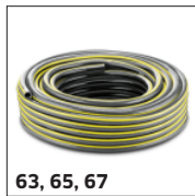
63, 65, 67