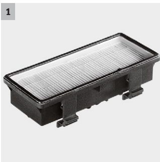
1 HEPA filter za čist izdovni vazduh

Tih i okretan iusisivač s nožnim prekidačem i štitnikom. Prikolica s 4 točka. Rasklopiva kuka za kabl i motalica. Odlaganje podne mlaznice i utičnica za el. usisnu četku.