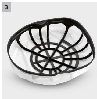
3 Glavni korpa filter