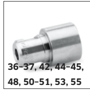
36-37, 42, 44-45, 48, 50-51, 53, 55