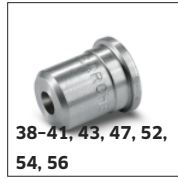
38-41, 43, 47, 52, 54, 56