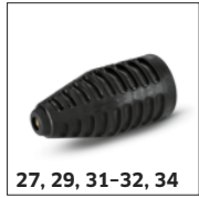
27, 29, 31-32, 34