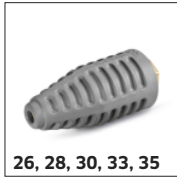
26, 28, 30, 33, 35