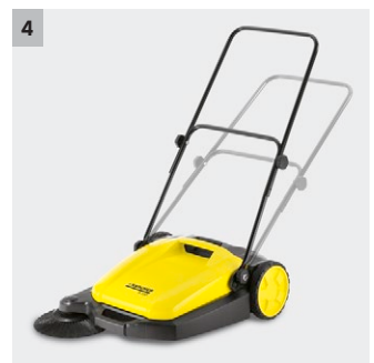
4 Adjustable push handle