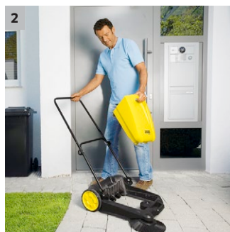
2 Komforan rezervoar za đubre