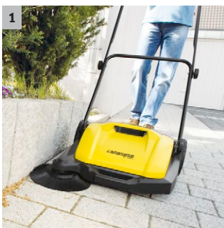
1 Bočna metla