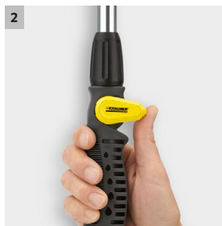
2 Podešavanje količine protoka vode jednom rukom i ON/OFF funkcija