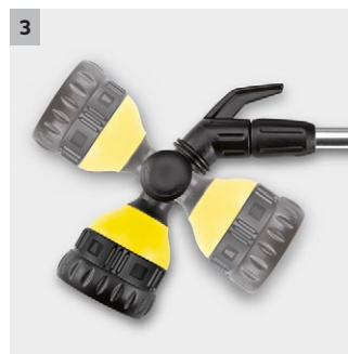
3 Pokretna glava za prskanje (180°)