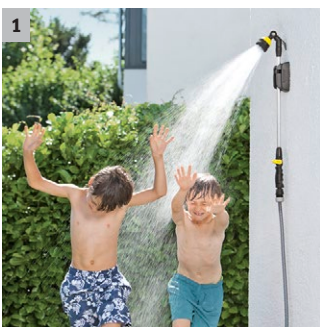
1 6 vrste mlazna oblika