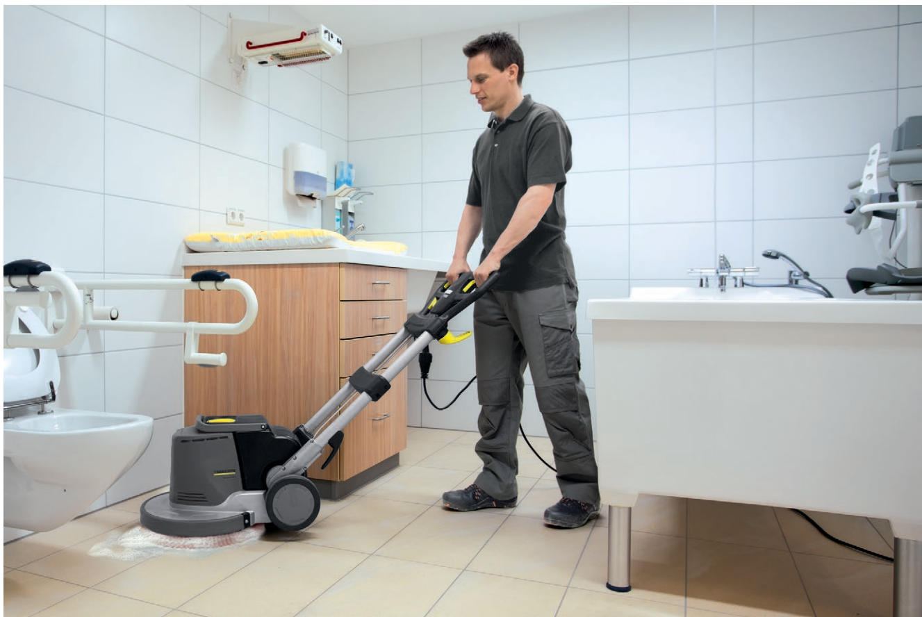
BDS 43/Duo C Adv