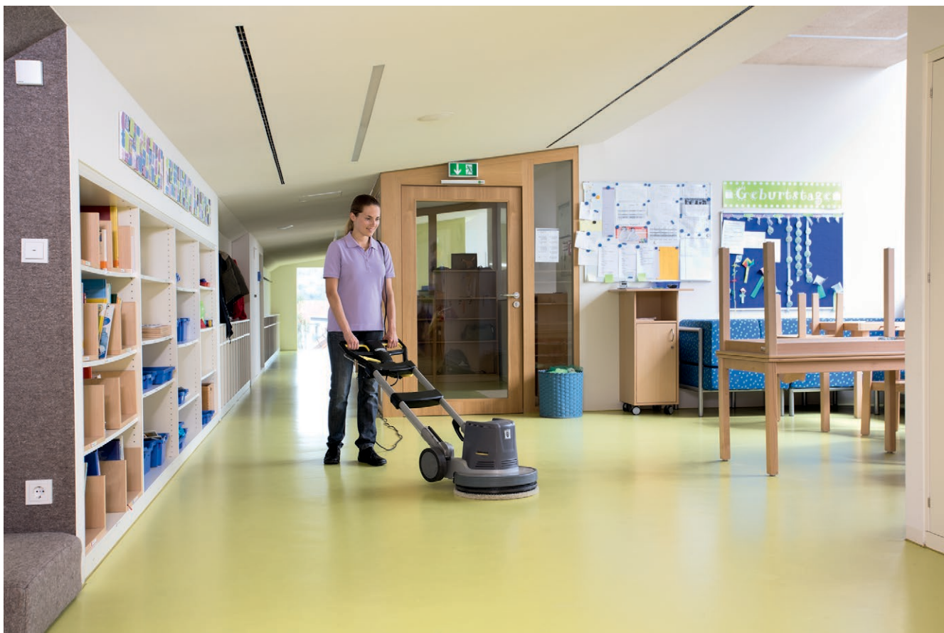
BDP 43/450 C Adv