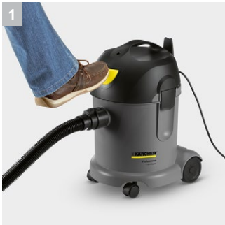
1 สวิตช์แบบเท้าเหยียบเพิ่มความสะดวกสบาย

เครื่องดูดฝุ่น T 14/1 Classic: น้ำหนักเบา ทนทาน ราคาสบายกระเป๋า ทั้งยังดูดฝุ่นได้อย่างทรงพลัง ใช้งานง่าย พร้อมถุงเก็บฝุ่นขนาด 14 ลิตรเพื่อให้ใช้งานได้อย่างต่อเนื่อง