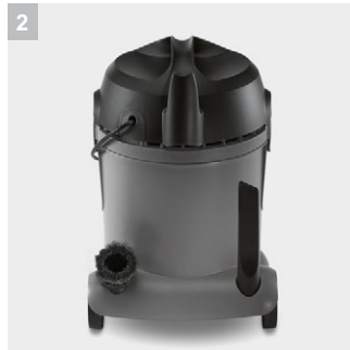
2 ที่เก็บอุปกรณ์เสริมที่ใช้งานได้จริง