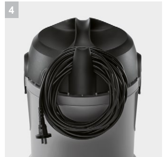
4 ที่เก็บสายไฟอย่างปลอดภัย