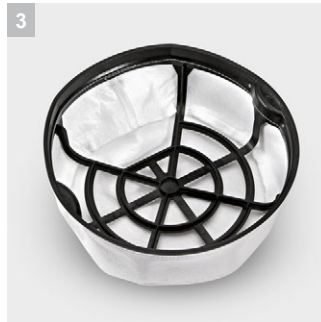
3 ถังกรองหลักเพื่อประสิทธิภาพสูงสุดในการกรองฝุ่น