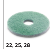
22, 25, 28