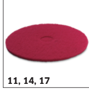
11, 14, 17