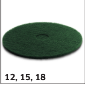
12, 15, 18