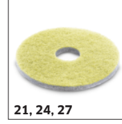
21, 24, 27