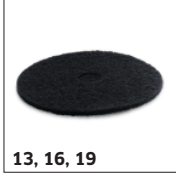
13, 16, 19