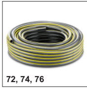
72, 74, 76