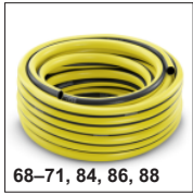
68–71, 84, 86, 88