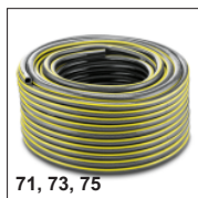
71, 73, 75