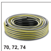
70, 72, 74