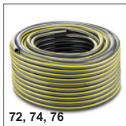
72, 74, 76