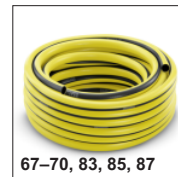
67-70, 83, 85, 87