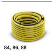
84, 86, 88