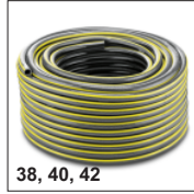
38, 40, 42