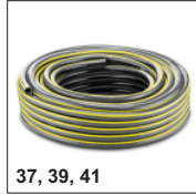
37, 39, 41