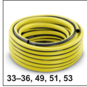
33-36, 49, 51, 53